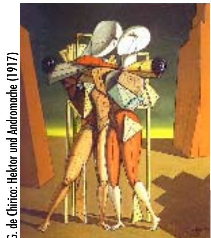
G. de Chirico: Hektor und Andromache (1917)

In der Szenerie der Gender-Debatten gibt es neben Opfer und Befreier – auch Täter , und das ist „die Mehrheit“. Glaubt man den schwullesbischen Lobbygruppen und Medienberichten, dann werden Homo-, Bi- und Transsexuelle täglich in allen Instanzen diskriminiert, z. B.